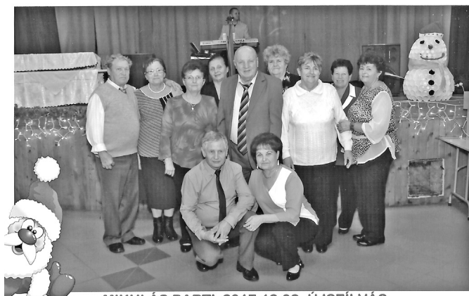
MIKULÁS PARTI 2017.12.02. ÚJSZILVÁS